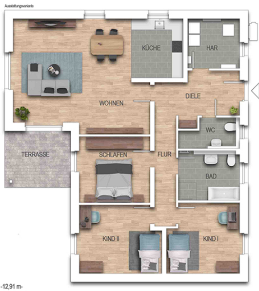
KFN Cumulus 67K Grundriss EG